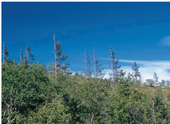
Figur 2. Glest bestånd av maximalt 60–70 år gamla tallar, som etablerats 25 meter ovanför trädgränsens läge omkring 1915.

Tallens trädgräns har på något mindre än ett sekel flyttats cirka 5 km västerut, upp över