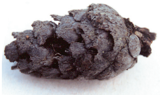
Figur 9. Kotte av sibirisk lärk anträffad i mossegöl (figur 7) och daterad till 8160 år före nutid. A cone of Larix sibirica found in a bog pool (Fig. 7) and radiocarbon-dated to 8160 cal. BP.

kalfjäll är det uppenbart att klimatet under flera årtusenden efter isens avsmältning var både varmare och torrare än i nutiden. Klimat-typen var sannolikt ännu mer kontinental än idag, vilket antyds av förekomsten av sibirisk lärk Larix sibirica för drygt 8000 år sedan (figur 9). Närmaste spontana förekomster av lärkar finns idag på västra stranden av Onega,