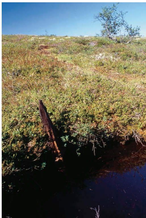
Figur 7. I en liten göl i kanten av en mosse hittades subfossil av tall (7480 år), sibirisk lärk (8160 år) samt gran (9030 år). Tallstammen är uppställd i gölkanten.

In a small pool at the fringe of a bog, subfossil pine (7480 cal. BP), Siberian larch (8160 cal. BP) and spruce (9030 cal. BP) were recovered. The pine remnant is displayed at the pool margin.