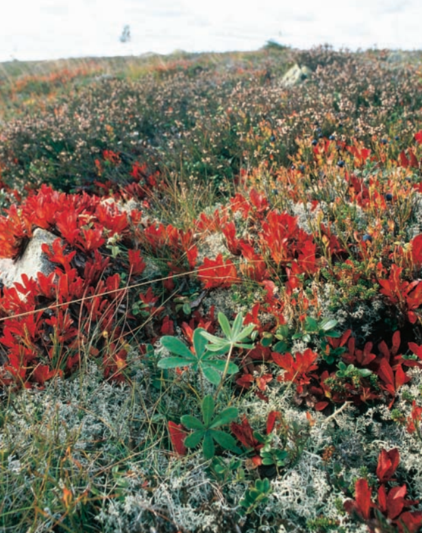
Figur 12. Ung planta av blomsterlupin i helt intakt lavhed med gulvit renlav, ribbär, lingon, ljung och kruståtel. Liknande, nyetablerade förekomster finns i andra dalafjäll (Kullman 2004b).

A young plant of Lupinus polyphyllus found growing in undisturbed lichen heath. Similar occurrences are reported from nearby mountains (Kullman 2004b).