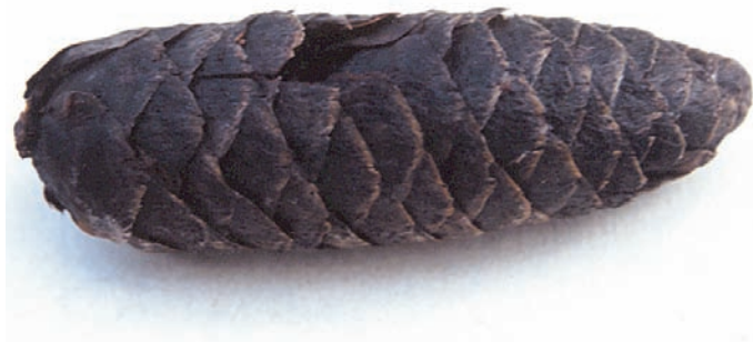
Figur 10. Grankotte med karaktärer av altaigran Picea abies ssp. obovata anträffad i mossegöl (figur 7) och daterad till 9030 år före nutid.

A spruce cone with scale characters of Picea abies ssp. obovata found in a bog pool (Fig. 7) and radiocarbon-dated to 9030 cal. BP.