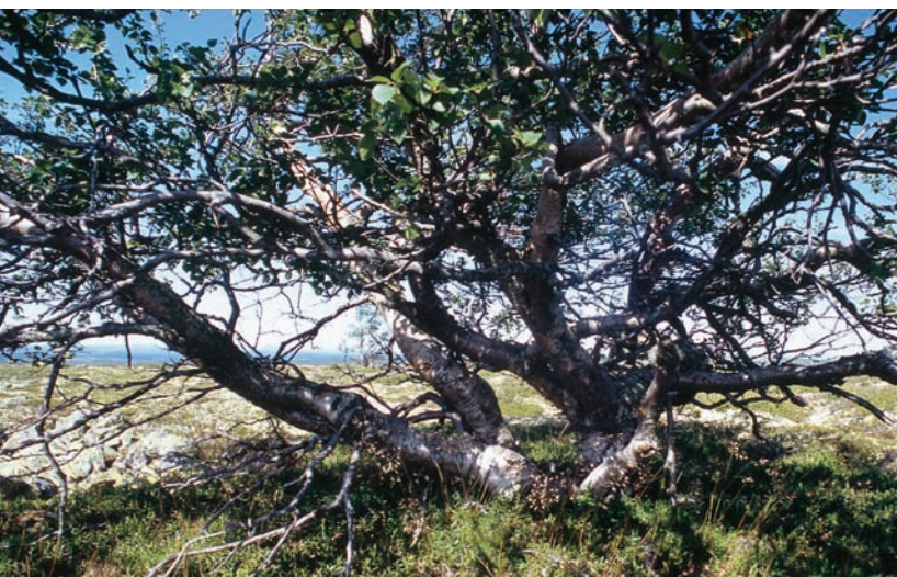
Figur 4. Björkens nya trädgräns (940 m ö.h) utbildas av mycket gamla individer (61° 37,978' N; 12° 38,800' Ö). Den grövsta stammen visade 211 årsringar vid rothalsen. En liggande död stam tillhörande samma individ har enligt kol-14-datering dött för 375 år sedan. Björken kan alltså vara äldre än 500 år.

The advanced birch treeline is set by very old individuals. The thickest living stem displayed 211 annual rings at the root neck. A downed and decaying stem is radiocarbon-dated to 375 cal. BP. Thus, this birch may be older than 500 years.