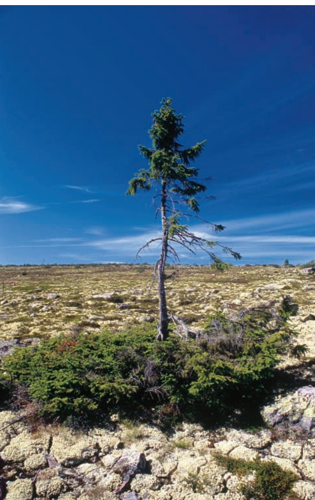
Figur 5. Gran strax under trädgränsen (910 m ö.h., 61° 38,356' N; 12° 40,589' Ö). Ett tätt grenverk närmast marken markerar vinterns snödjup. Ett gynnsammare klimat har framkallat en upprätt stam sedan början av 1940-talet. Granen var precis två meter hög 1974 och har därefter ökat till fem meter. I marken under granen har fyra "generationer" av subfossila granrester grävts fram och daterats (figur 11).

The advanced birch treeline is set by very old individuals. The thickest living stem displayed 211 annual rings at the root neck. A downed and decaying stem is radiocarbon-dated to 375 cal. BP. Thus, this birch may be older than 500 years.